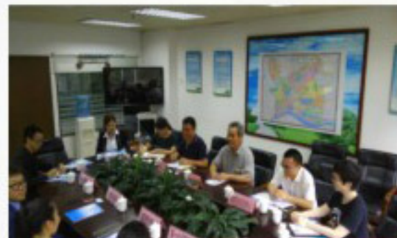
梅花村街召开中介机构招商引资座谈会

7月18日下午，梅花村街道办事处召开中介机构招商引资座谈会，戴德梁行、德洋地产等四大中介在內的11家中介机构代表参加。座谈会介绍了越秀区“钻石29条”招商引资扶持政策，推介了梅花商圈在商务楼宇、交通设施、教育配套、新兴业态、公共服务等方面的优势，鼓励支持各中介机构大力为越秀区、梅花村街的招商引资工作牵线搭桥，促进优质企业落地生根、开花结果，实现双赢。区投资促进中心的工作人员也对“钻石29条”进行现场解答。中介代表纷纷表示，一定会充分利用好政策，引入优质企业，双赢发展。