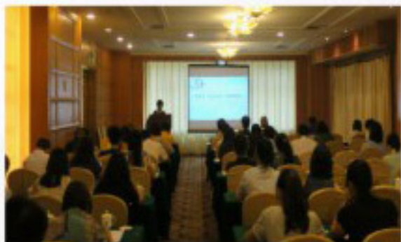
大塘街“1+3”政策培训班

2017年8月15日大塘街办事处举办“越秀区‘1+3’政策培训班”，邀请了辖内35家纳税额500万以上的重点企业及重点楼宇前来参加培训，由区投资促进服务中心人员宣讲“钻石29条”政策的主要条款，介绍企业、人才、园区楼宇的专项扶持政策及具体案例分析。多家企业（包括城投集团、中山大学附属口腔医院、广东省盐业集团等）表示对该政策的支持和兴趣，并就企业自身情况向有关部门提出问题，区协税办、区地税、区国税、大塘街派出所、工商所参与政策答疑环节。会后，南油对外服务公司对我街经济办表示出对多项政策有申请意愿。