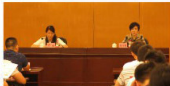
越秀区“钻石29条”政策宣讲座座谈会